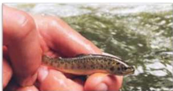
Truitelle née durant l'hiver 2020/2021

Après un inventaire 2019 marqué par l'absence de truite fario au droit de ce secteur historiquement colonisé et situé à l'aval proche des parcours classés en 1ère catégorie, l'inventaire 2021 a permis la capture d'une truitelle de 80 mm et d'un géniteur de 315 mm. La densité salmonicole demeure TRES FAIBLE , voisine de la valeur mesurée en 2017. Outre les conditions hydrologiques et climatiques particulièrement contraignantes des années 2019/2020, la population de truite fario a été pénalisée en 2021 par les débits hivernaux importants et par le coup d'eau de la fin juin qui ont probablement dégradé le recrutement en truitelles.