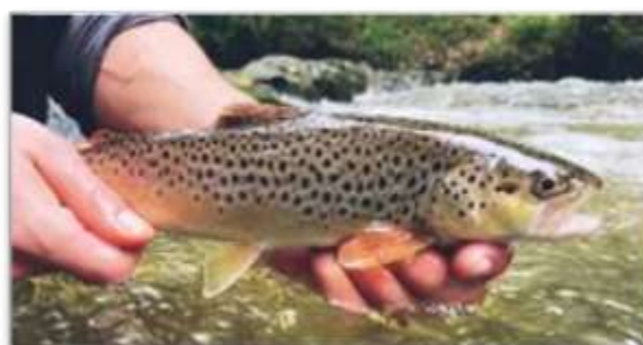
Géniteur probablement natif de la Bouble